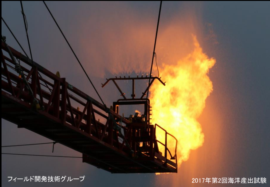
生産手法開発グループ