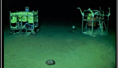
環境モニタリングシステム