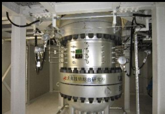
大型室内産出実験装置